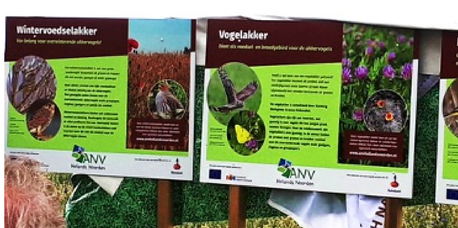
Afbeelding: ANV Hollands Noorden

De agrarische natuurvereniging Hollands Noorden en de provincie Noord-Holland werken samen voor het realiseren van een zo groot mogelijk aantal wintervoedselkokers. Daarvoor zaaien boeren hun land in met de achteruitgang van zijn maar ook muizen en ratten te keren. Deze manier wordt geprobeerd de achteruitgang van boerenlandieren inclusief vogels te keren. Uiteraard gaat dit ten koste van de inkomsten van de boeren, dus worden die door de provincie gecompenseerd. Boeren zien al steeds meer vogels en hazen op hun akkers. Hopelijk kan dat worden bevestigd door gedegen onderzoek.